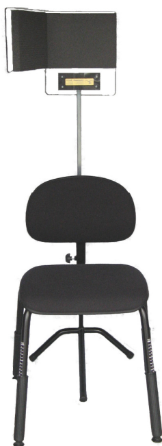
25 mm tyk lydabsorption med høj lydabsorptions koefficient