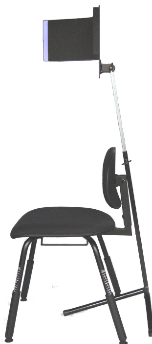
Falko® lydkærm S600 bag Musica Proff. orkesterstol