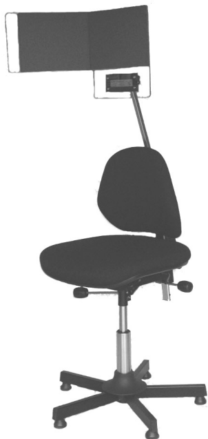
Falko® Global orkesterstol med Falko® cello lydkærm S 600