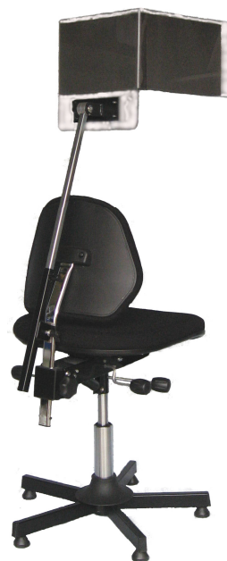
Naturligvis transparent polycarbonat

Lydkærm Falko® 600 er både for cello, for kontrabas kan lydkærmen fås med ekstra højde ved at indsætte ekstra teleskoprør.